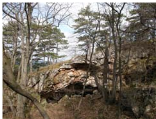
Der Steinerne Stadl

Fünf Minuten später folge ich wieder der rot markierten Markierung entlang des Forstweges Richtung Größenberg, der sich für die kommende Stunde manchmal eben, dann wieder ansteigend, aber stetig an Höhe gewinnend durch den Wald zieht. Eine knappe Stunde später, ich befinde mich bereits am Kamm des Malleiten Berges erwarte ich bereits das Auftauchen des nächsten Etappenzieles. Ein Blick auf die Wanderkarte zeigt mir, dass der Steinerne Stadl hier irgendwo sein muss. Kurz bevor der Weg wieder abwärts führt, entdecke ich schließlich einen alten Wegweiser, folge ihm und stehe kurz darauf vor einem beeindruckenden Naturbauwerk.