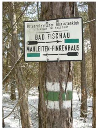
Mahlleiten oder Malleiten?

Eine Kuriosität fällt mir wieder ein und lässt mich schmunzeln, während ich hier sitze und nachdenke. Wenn er nicht gerade einen Wutanfall hat und ganze Berge zerschmettert, sitzt der Teufel bekanntlich doch auch gerne im Detail. Wie sonst wäre zu erklären, dass die auf Wanderkarten benannte Hofmannshöhle auf dem Hinweisschild des Österreichischen Touristenklubs zur Hoffmannshöhle mutiert. Der auf Karten angegebene Malleiten Berg wird auf den Wegtafeln einerseits zur Malleiten, andererseits aber auch zur Mahlleiten!