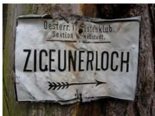
Zigeunerloch = Zigeunerhöhle

Der Weg umrundet den Pfaffenkogel weiter, nach vielleicht 10 Minuten kreuzt ein von links kommender, grün markierter Weg meine Route. Von hier an geht es der grünen Markierung folgend hinunter in den bezaubernden Marchgraben. Links und rechts des Weges ragen steile, mit Felsen durchsetzte Hänge nach oben, ein schmales Bächlein fließt im Talgrund gemütlich vor sich hin.