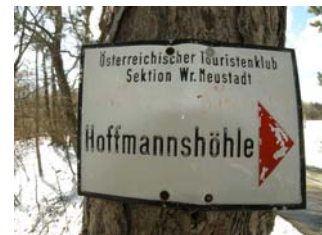
Wegweiser zur Hoffmannshöhle

Einige Minuten später erreiche ich eine schmale, asphaltierte Straße, ich wende mich nach rechts und folge ihr bis ich nach etwa 10 Minuten auf ein Hinweisschild stoße: „Hoffmannshöhle“.