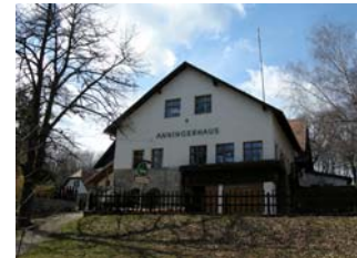
Das Anninger Schutzhaus

Das Anninger Schutzhaus (624m), heutzutage meistens Anningerhaus genannt, ist der zentrale Knotenpunkt des gesamten Wandergebietes, hier treffen sich viele verschiedene Wege, hierher führt sogar eine (nicht öffentliche) Straße.