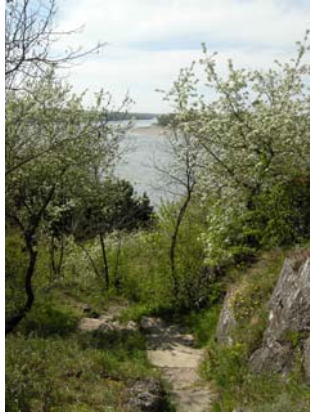
Das letzte Wegstück

Der kurze, sehr steile Weg an der Südwestflanke nach unten gebietet Vorsicht, um auf dem Kiesel nicht auszurutschen. Nach fünf Minuten befinden wir uns am Fuße des Schlossberges, wenden uns nach rechts, umrunden jetzt den Hügel und treffen 15 Minuten später wieder auf den Weg, den wir für den Anstieg gewählt haben. Nun geht es entlang der Stadtmauer zum Ungartor und durch die Krüklstraße zurück zum Bergbad. Wir kreuzen dort den schon bekannten Keltenweg, der sich unmittelbar hinter dem Bergbad nach links hinunter zur Donau zieht. Ein kurzes steiles Wegstück noch, ein letzter Ausblick über die Stadt und die Au. 20 Minuten später befinden wir uns erneut beim Bahnhofsgebäude.