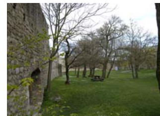
Der Burghof der Heimoburg

20 Minuten dauert der gemütliche Aufstieg entlang des befestigten Weges, dann stehen wir vor dem Haupttor der Heimoburg und betreten die Burg.