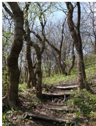
Ein netter Pfad

Nachdem wir uns die Reste der Keltischen Wallanlage angesehen, die Informationstafeln gelesen und den weiten Rundumblick genossen haben, folgen wir der roten Markierung des Keltenweges, verlassen die Hochfläche und steigen an der Ostflanke ab, ein netter, schmaler Pfad schlängelt sich nach unten und bringt uns in 10 Minuten an den Fuß des Berges.