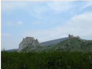
Ruine Theben (Slowakei)

slowakische Donauufer, wo sich die Reste der Ruine Theben auf einem Felsen gruppieren und vor dem Thebener Kogel für unsere Fotos posieren.