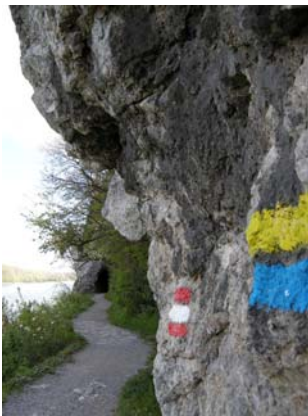
Es geht spannend los...

Hainburg an der Donau, ein sonniger Tag Mitte April. Vor wenigen Minuten haben wir das Bahnhofsgebäude verlassen und sind dem, direkt neben dem Fluss verlaufenden Weg stromabwärts gefolgt, vorbei an der Schiffsanlegestelle und dem Donauparkplatz. Jetzt wird es spannend: Linkerhand der breite Strom, rechts senkrechte Felswände, dazwischen ein schmaler Weg, der 50 Meter vor uns in einem Tunnel verschwindet.